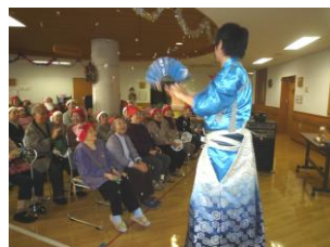
マジックショーで楽しんだ後は踊りにうっとり...