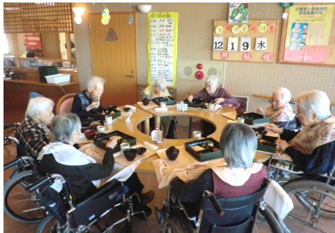
豪華なクリスマスランチで女子会(?)しています