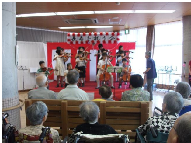
長寿を祝う会のお祝いに“スズキメソード”の皆様による、バイオリンの演奏がありました。小さな子供達の演奏もあり、皆様お祝いの場にふさわしい素敵な音色に聴き入っていました。