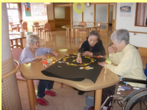
皆さん熱心に作成中です。