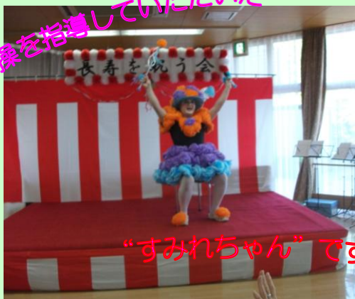
“すみれちゃん”です