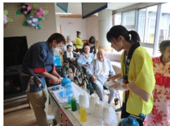
どの味にしようか迷ってしまいます