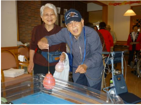
ヨーヨーつれたよ！！