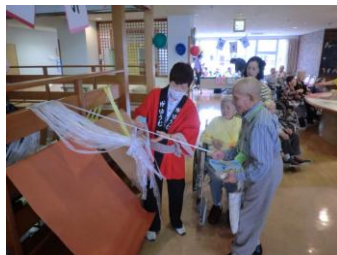
どんな物が引けるかドキドキでした