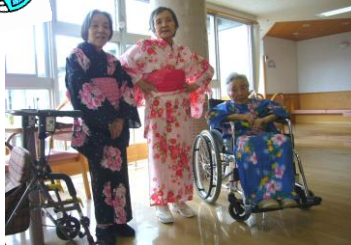
久々の浴衣で昔を思い出します