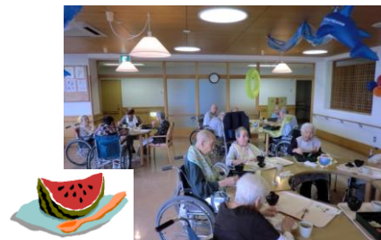
イベント食に皆さん満腹でした

★次回のイベント予定 9/8 (土) 長寿を祝う会 ・ワンポイントセミナー 「認知症について」 ・催し物 「スズキメソード、バイオリンコンサート」