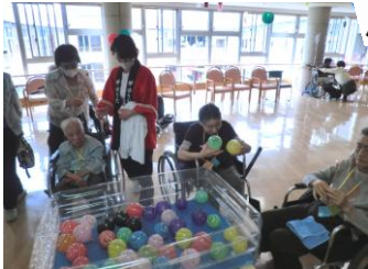
なかなかすくえず・・・ 悪戦苦闘中